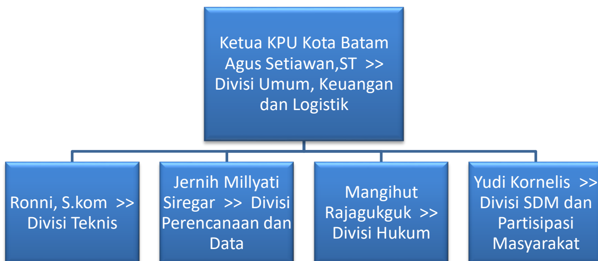
TABEL 1 STRUKTUR ORGANISASI KOMISI PEMILIHAN UMUM KOTA BATAM

Berdasarkan Peraturan Komisi Pemilihan Umum Nomor 22 Tahun 2008 tentang Perubahan Peraturan Komisi Pemilihan Umum Nomor 06 Tahun 2008 tentang Susunan Organisasi dan Tata Kerja Sekretariat Jendral KPU, Sekretariat KPU Provinsi dan Sekretariat KPU Kab./Kota, Struktur Organisasi Komisi Pemilihan Umum Kota Batam Tahun 2017 adalah sebagai berikut :